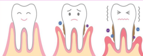
Здоровый зуб Начало проблем Периодонтит

Появление первых признаков неблагополучия (кровоточивость десен при чистке зубов) является сигналом того, что страдает качество очищения зубов и околозубного пространства и необходима помощь стоматолога, который проведет профессиональную чистку зубов и даст рекомендации по лечению. Здоровый периодонт - профилактика потери зубов в зрелом возрасте.